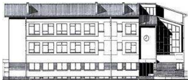
Elewacja frontowa budynku Gimnazjum

Należy zatem stwierdzić, że w dłuższej perspektywie czasu, utrzymanie jednego Gimnazjum jest korzystniejsze zarówno ze względów ekonomicznych, dydaktycznych jak i społeczno-wychowawczych.